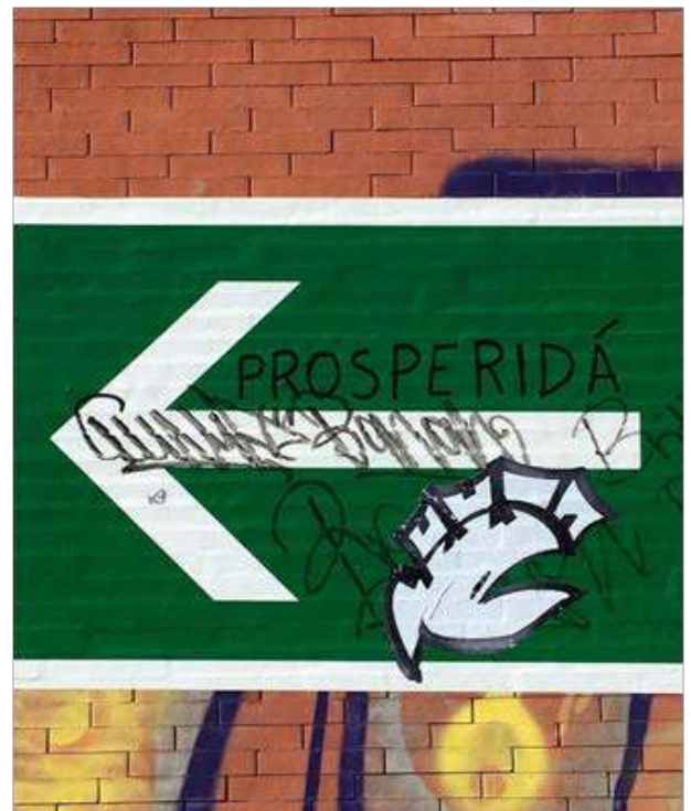
Fotografía del barrio de Ciutat Vella (València).

La preocupación compartida con otras disciplinas afines al estudio de la vulnerabilidad urbana (Sociología, Arquitectura, Geografía, Ciencias Políticas...) presenta un es-