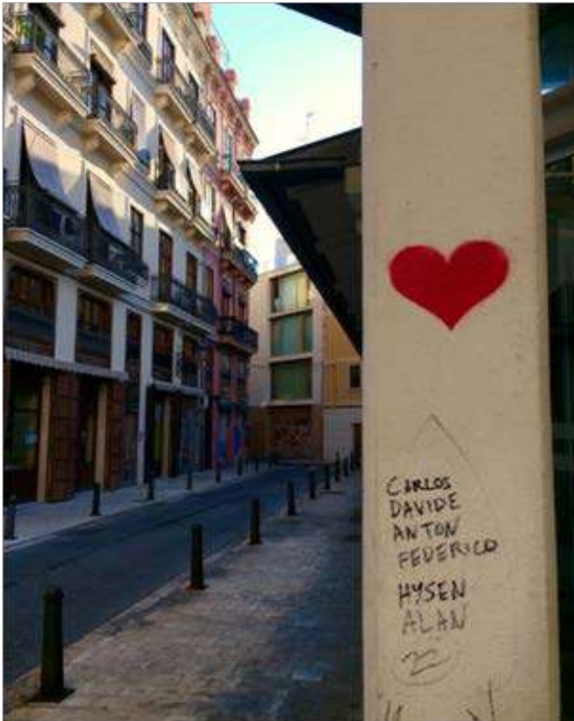
Fotografía del barrio del Besòs (Barcelona).

el COVID – 19 ha cristalizado en el conjunto de los territorios (urbanos y rurales) de todos los países con un notable impacto en la dimensión urbana, especialmente en aquellas áreas que presentan mayor degradación y concentración de múltiples factores de riesgo. En las últimas décadas, el crecimiento de la vulnerabilidad y la exclusión social, ha mostrado sus consecuencias en el aumento de las desigualdades entre regiones, ciudades y territorios. Según Naciones Unidas (2018): “detener y corregir el aumento de la desigualdad también es vital para que en adelante el crecimiento sea equilibrado y sostenible”.