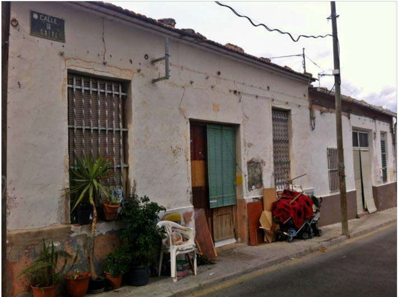
Fotografía de una vivienda en el barrio de San Agustín (Alicante).

No es suficiente luchar por objetivos justos; hay que hacerlo, además, con los métodos correctos.